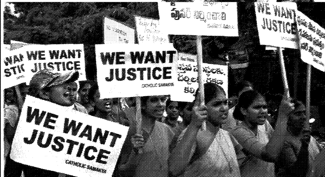
A sinistra: manifestazione di nazionalisti hindu. Qui sopra: un corteo di cristiani dell'Orissa per protestare contro gli attacchi degli induisti. Sotto: musulmani indiani in preghiera.